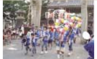
ー事業推進委員会の暑い夏ー

本年度事業推進委員会は、2大事業をかかえていました。一つは、ロシア国立ポリショイサーカスでもう一つがこののんた大提灯パレードと、8月3日、同日開催という今までにない暑い夏を向かえました。当然のごとく、委員会メンバーはもとより、JCメンバーにとってもハードスケジュール委員会メンバーは、とにかく両方成功させなければという不安とあせりでいっぱい、当日もサーカス組、祭り組を分担し、私は祭り担当で朝から町内の台車取立作業を回り、パレードの最終確認と、この日だけは”のんた”に集中と気持ちを切り替え、何とかパレードを向かえる事が出来ました。本年度は、コース変更等あり、町内の方々や関係者の方々に大変ご迷惑をお掛け致しましたが、皆さんのお陰で無事故もなく、終わることができ”感謝”の気持ちでいっぱいです。有難うございました。